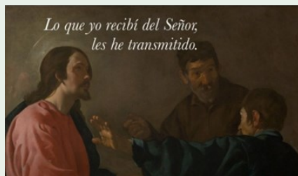
Lo que yo recibí del Señor, les he transmitido.

Domingo catequético... ¡YA VIENE! Este año, la Iglesia celebrará el Domingo Catequético el 20 de septiembre de 2020. El tema 2020 es Lo que yo recibí del Señor, les he transmitido. Aquellos a quienes la Comunidad haya designado para servir como catequistas serán llamados a ser comisionados para su ministerio. El domingo catequético es una oportunidad maravillosa para reflexionar sobre el papel que desempeña cada persona, en virtud del bautismo, al transmitir la fe y ser un testigo del Evangelio. El domingo catequético es una oportunidad para todos de volver a dedicarse a esta misión como una comunidad de fe. ¡Los catequistas serán comisionados el domingo, 20 de septiembre EN LA MISA DE 9:30 AM y 12:30 PM (¡Y por Facebook!)